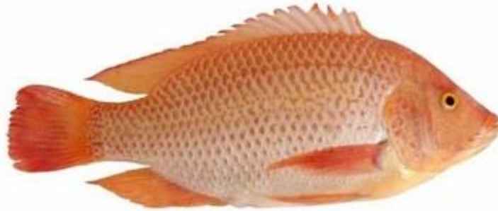
Nombre común: Tilapia roja o mojarra roja Nombre Científico: Oreochromis sp.