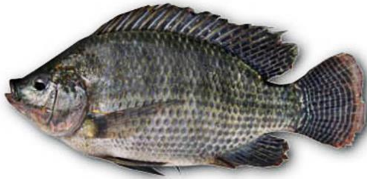
Nombre común: Tilapia negra o mojarra negra Nombre Científico: Oreochromis niloticus