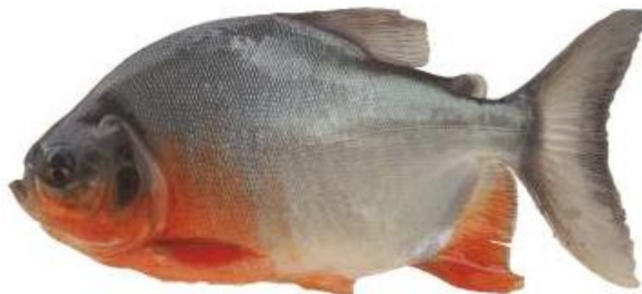
Nombre común: Cachama blanca o híbrida Nombre Científico: Piaractus brachypomus